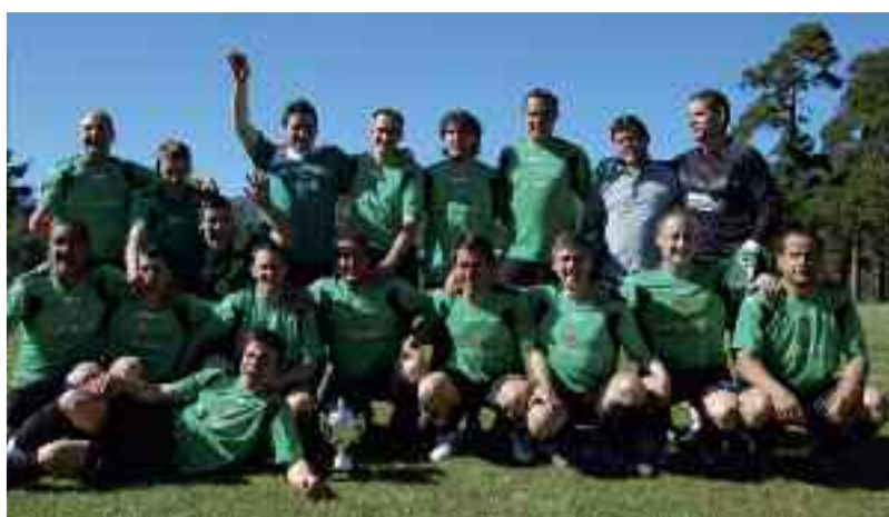
El equipo de Ágreda resultó ganador del Campeonato de Fútbol de Interpueblos